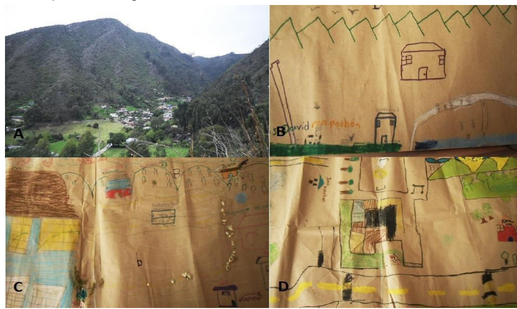
Gráfico 6: Fotografia do Cerro Majuy e os mapas construídos pelos estudantes.

Sobre os níveis de organização e atributos de biodiversidade, podemos dizer que os estudantes se colocaram no nível de organização das espécies sem reconhecer o nível de ecossistemas ou genético (Bermudez e De Longhi, 2008). Como mencionou Jimenez (2009) também é comum encontrar uma confusão entre os termos espécies e organismos.