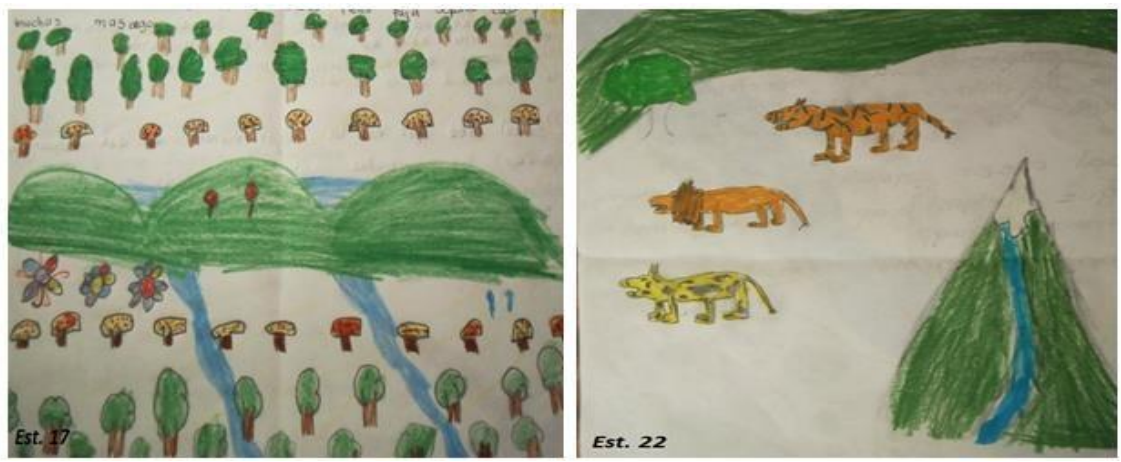
Gráfico 4. Representações que incluem variedade de organismos.

Alguns estudantes consideram o componente da variedade em uma explicação ecológica / biológica incorporando alguns animais, plantas e em alguns casos fungos e microrganismos (Gráfico 4). De acordo com Garcia e colaboradores (2003) esta representação corresponde a uma percepção aditiva do meio ambiente, independentemente de suas inter-relações, onde geralmente são mais referenciados os componentes que os processos.