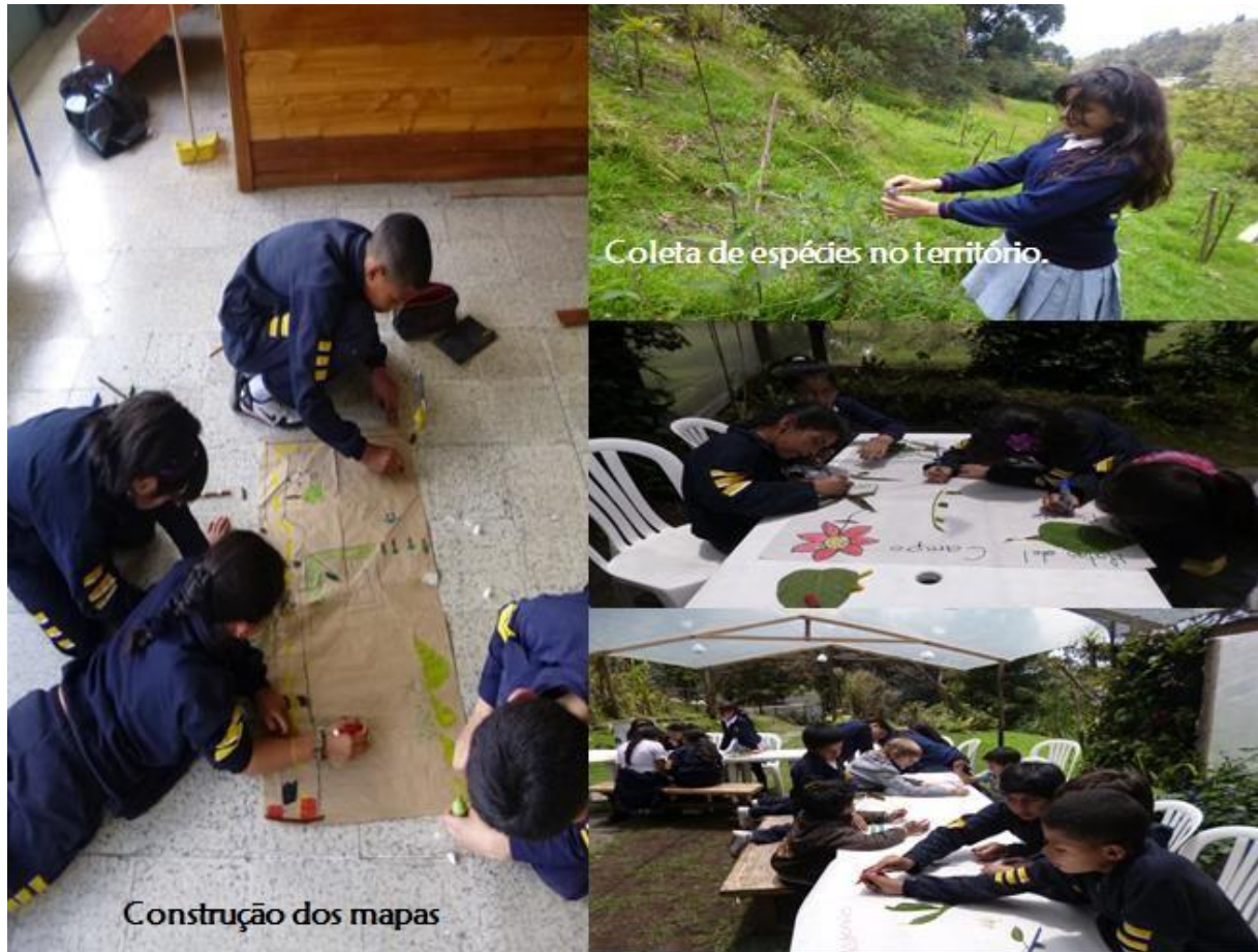
Gráfico 2: Atividades para a identificação dos conhecimentos prévios dos estudantes no território.

Primeiro, os alunos realizaram o desenho do que eles consideravam biodiversidade e foram também confrontados com a situação da possível construção de um parque de diversões no Cerro Majuy contra o qual seus pontos de vista eram expostos. Posteriormente, por grupos, os estudantes construíram o mapa do seu território, destacando o lugar mais e menos biodiverso do mesmo; e, finalmente, foi realizada uma visita a algumas áreas do território onde os alunos coletaram material biológico das espécies conhecidas para eles, em seguida, socializaram a informação recolhida aos seus companheiros da turma (gráfico 2). A continuação são apresentados os resultados das atividades.