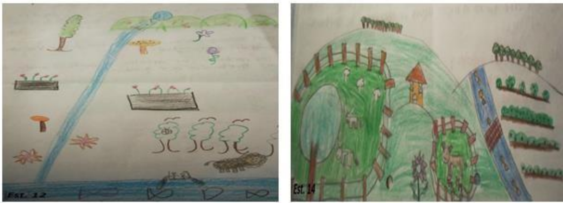
Gráfico 5: Representações que incluem o componente cultural.

Algumas explicações ligadas a partir do cultural em que o homem foi incluído foram realizadas, geralmente o humano aparece extraindo recursos da natureza (Gráfico 5).