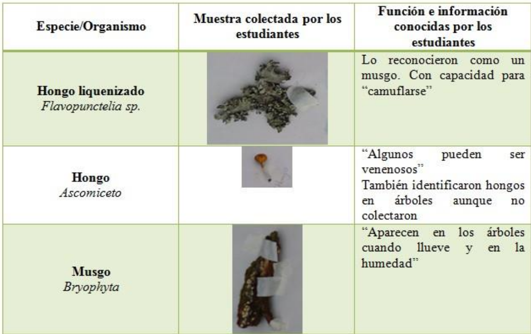
Gráfico 7: Algunas plantas inferiores e fungos coletados pelos estudantes.

As respostas dos estudantes sobre quais ações seriam as melhores para retornar a água no Cerro Majuy mostram que eles têm interesse em que isso aconteça, mas que têm dificuldade em discutir como. Bermudez e De Longhi (2008) nota que os alunos consideram importante preservar a biodiversidade, mas não têm um alto nível de conceituação de como. A partir da descrição de Brown (2008), se pode afirmar que é necessário promover nos alunos um olhar sistêmico da realidade natural, porque senão, provavelmente eles não terão a capacidade cognitiva para discutir seus pontos de vista sobre a biodiversidade.