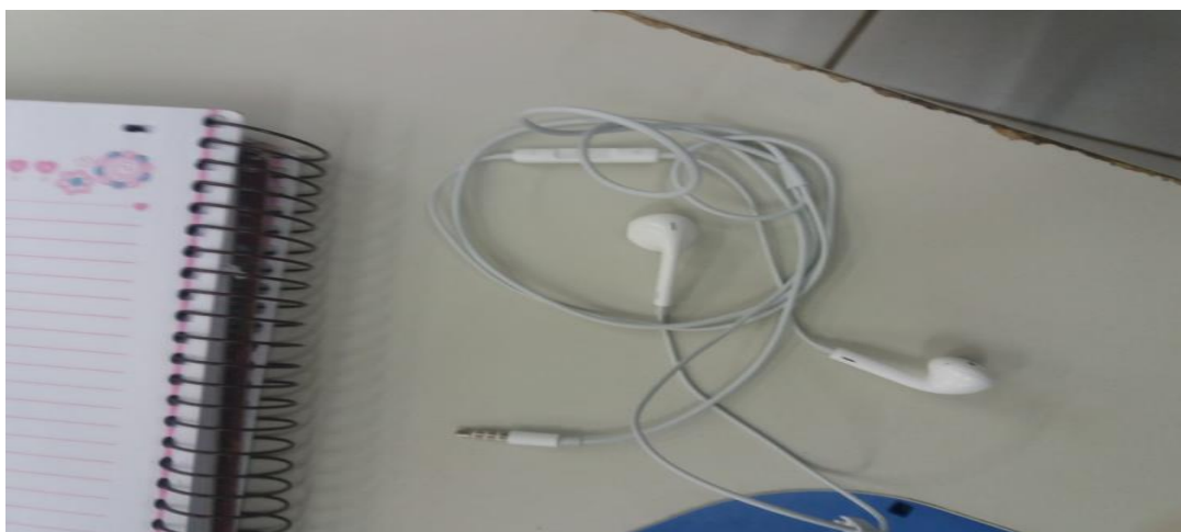
Figura 4: Fone de ouvido usado para medir o dedo.