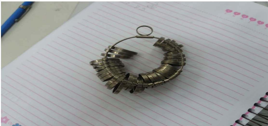
Figura 2: Aneleira