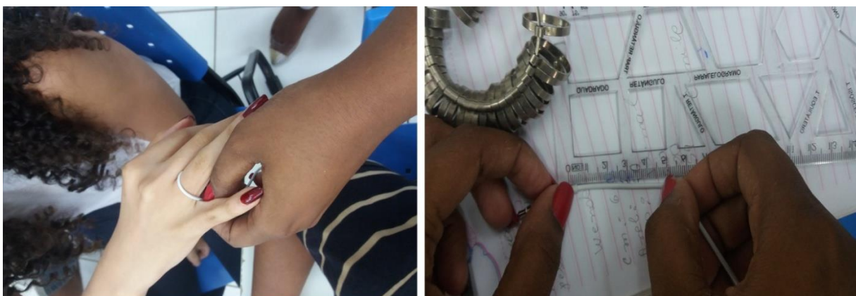
Figura 5: Medição do dedo.