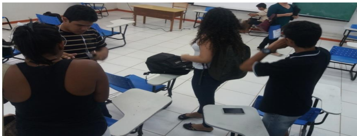
Figura 3: Grupo no qual foi desenvolvida a atividade.