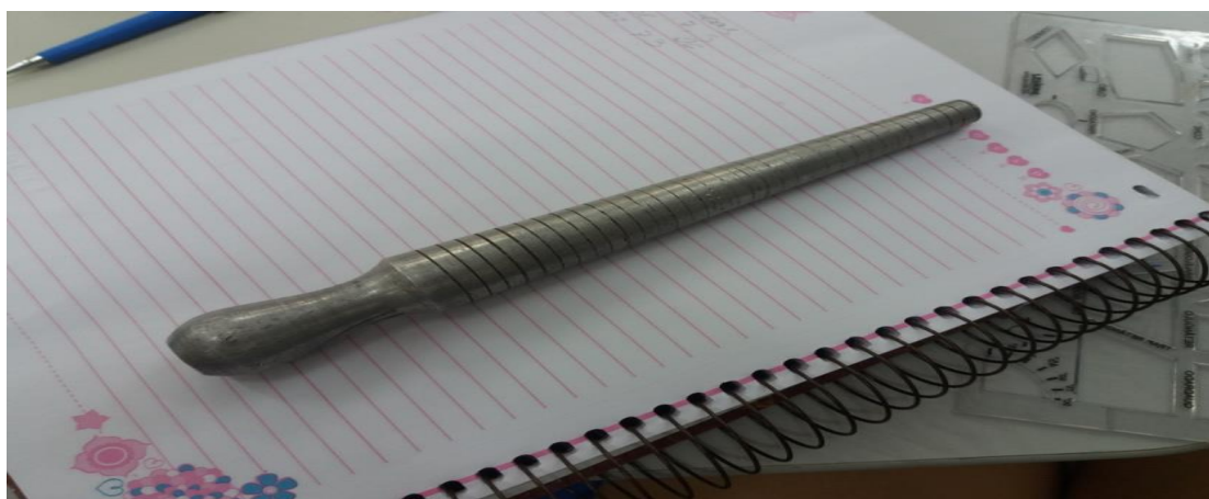
Figura 1: Tribule