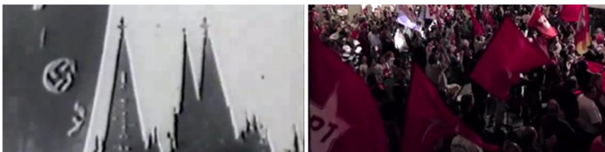
Figura 2: A disseminação do símbolo de representação na comunicação visual do partido. Imagens retiradas do filme "Vitória do Ocidente" (1941) e do último programa eleitoral de Lula de 2002 (Disponível em: https://www.youtube.com/watch?v=-XYC9wxJXoc ).

A produção contemporânea de campanhas eleitorais utiliza-se do mesmo recurso, pondo por toda parte quanto pode o símbolo de representação do partido, aderindo de maneira primária ao passado estético abordado (Figura 2 à direita).