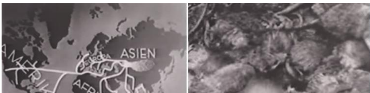
Figura 1: Cenas de "O Eterno Judeu", comparando a disseminação do povo judaico à proliferação de ratos. Imagens retiradas do filme "O Eterno Judeu" (1940).

Como exemplo temos o filme "O Eterno Judeu" (1940) de Fritz Hippler, cineasta que chegou a dirigir o departamento de filmes do referido Ministério da Propaganda. Nele, existe um paralelo narrativo entre a proliferação de ratos pelo continente europeu com a diáspora dos judeus e sua distribuição pelo mundo, de forma a se revelar filmicamente como um mecanismo de manipulação de massas que pode ter contribuído para a formação da ideia da necessidade de um extermínio desse povo (Figura 1). Obras com este viés eram exibidas publicamente. "O Eterno Judeu", especificamente, foi exposto em todas as cidades alemãs e em outras recém-conquistadas (FRIGERI, 2013). Em consequência de uma abordagem propagandística tão incisiva, junto aos demais estratagemas de Hitler, os, então, considerados "impuros" foram levados ao campo de concentração e exterminados, culminando na "limpeza" racial e no maior genocídio já registrado na história.