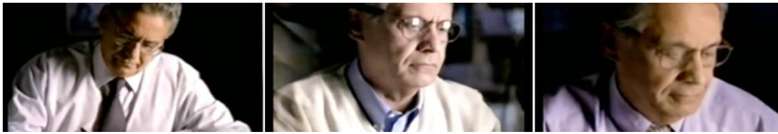
Figura 5: FHC repercute a dinamicidade de sua campanha eleitoral em suas ações. Imagens retiradas do programa eleitoral de FHC de 1994 (Disponível em: https://www.youtube.com/watch?v=KOAGz2ToU9 ).

Ainda no estudo da interrelação entre a estética das propagandas políticas contemporâneas e sua linguagem nos meados da Segunda Guerra Mundial, podemos eleger o recurso do contra-plongée como uma das formas de discurso imagético mais eloquentes no que tange à glorificação do poder, seja relacionada a um símbolo ou a um líder.