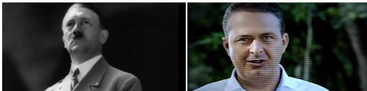
Figuras 7: Luz e atmosfera criada dão aos políticos uma aura divina, incitando a criação do mito. Imagens retiradas do filme “Triunfo da Vontade” (1935) e da campanha eleitoral do candidato Eduardo Campos de 2013 (Disponível em: https://www.youtube.com/watch?v=-oj8HLwf0EY ).

Esse discurso simbólico é tão subjetivo quanto poderoso, agregando ao perfil da pessoa em foco carisma, confiança, divindade, enquanto que sua postura, olhar adiante e gesticulações demonstram força e determinação. No programa eleitoral do partido PSB de 2013, Eduardo Campos está inserido nesse processo de construção de significados pela imagem.