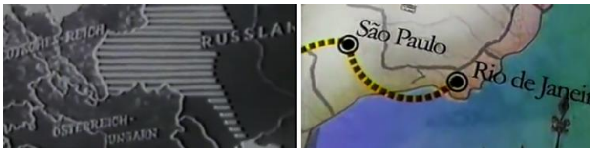
Figura 3: A utilização de mapas no intuito de imprimir dinamicidade na percepção do espectador. Imagens retiradas do filme “Vitória do Ocidente” (1941) e do último programa eleitoral de Lula de 2002 (Disponível em: https://www.youtube.com/watch?v=-XYC9wxJXoc ).

Inserido no mesmo processo subjetivo de propagação de valores agregados ao líder ou candidato, a partir da abordagem dos mapas, torna-se possível observar uma tendência na construção do ideal de representante político, que sempre traz consigo a ideia de avanço e dinamicidade recém-descrita. Tendo isso estabelecido, exemplifica-se o quadro com a campanha de Fernando Haddad de 2012 para prefeito de São Paulo, no qual, além da proliferação de gráficos, o candidato está o tempo todo movimentando-se, andando em direção à câmera, sempre ativo e desenvolto. De modo similar, Fernando Henrique Cardoso (FHC) aparece na imagem final de sua campanha para presidente de 1994 demonstrando empenho e altivez, entre outros exemplos. O princípio desse mesmo artifício estaria assim presente em "O Triunfo da Vontade" (1935), quando Hitler, segundo Kracauer, significativamente assistiu a parada de cinco horas de pé em seu carro em vez de em um palanque fixo (1988, p. 341). Esses simbolismos são, portanto, utilizados para estimular a plateia da forma como convém aos propagandistas.