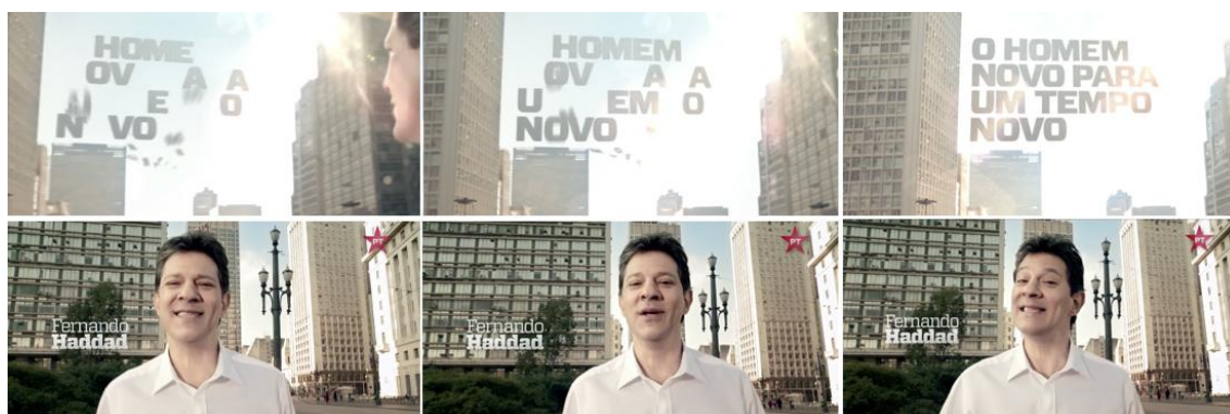
Figura 4: Produção de gráfico e dinamicidade do candidato. Imagens retiradas do programa eleitoral de Haddad de 2012 (Disponível em: https://www.youtube.com/watch?v=KVonaLj0PoA ).

Inserido no mesmo processo subjetivo de propagação de valores agregados ao líder ou candidato, a partir da abordagem dos mapas, torna-se possível observar uma tendência na construção do ideal de representante político, que sempre traz consigo a ideia de avanço e dinamicidade recém-descrita. Tendo isso estabelecido, exemplifica-se o quadro com a campanha de Fernando Haddad de 2012 para prefeito de São Paulo, no qual, além da proliferação de gráficos, o candidato está o tempo todo movimentando-se, andando em direção à câmera, sempre ativo e desenvolto. De modo similar, Fernando Henrique Cardoso (FHC) aparece na imagem final de sua campanha para presidente de 1994 demonstrando empenho e altivez, entre outros exemplos. O princípio desse mesmo artifício estaria assim presente em "O Triunfo da Vontade" (1935), quando Hitler, segundo Kracauer, significativamente assistiu a parada de cinco horas de pé em seu carro em vez de em um palanque fixo (1988, p. 341). Esses simbolismos são, portanto, utilizados para estimular a plateia da forma como convém aos propagandistas.