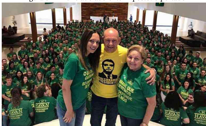
Figura 3 – Enunciado aderente imposto: o portador

As eleições presidenciais de 2018, no Brasil, foram marcadas pela intensa circulação de enunciados que representam posicionamentos ideológico-partidários, nas mídias militantes e nos programas eleitorais. São enunciados que, quando surgem, geram adesão dos indivíduos de determinados grupos sociais, pois refletem a posição ideológica e a personalidade coletiva. Um desses enunciados, que se constitui como o corpus de análise desta pesquisa, foi estampado nas camisetas de uniforme da rede de lojas Havan, do empresário Luciano Hang. O enunciado sofreu uma ressignificação e um revestimento ideológico, durante as eleições de 2018. A imagem, publicada na página online do Jornal Estado de Minas, em novembro daquele ano, dá destaque ao enunciado “O Brasil que queremos só depende de nós”, assim apresentado na Figura 3.