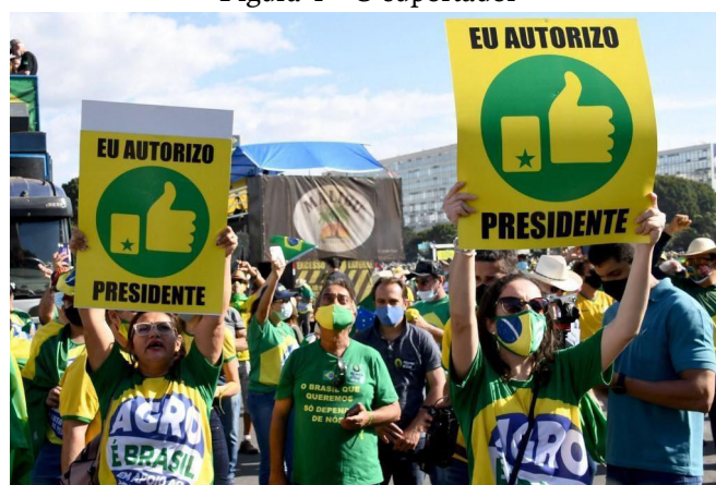
Figura 4 – O suportador

Caracterizar esse discurso como fiador de um mundo ético só é possível porque a ele é atribuído um caráter e uma corporalidade, ou seja, “uma representação do corpo do enunciador (e não, evidentemente, do corpo do autor efetivo)” (Maingueneau, 2013, p. 107). Não é, propriamente, o corpo físico de Bolsonaro, mas o corpo discursivo que ele representa. A adesão a esse discurso resulta no que Maingueneau (2020) chama de “incorporação”. O resultado é a emergência de suportadores do EA tido como signo ideológico do referido discurso, com o intuito de expressarem imagens de si, o ethos discursivo, tais como: sou conservador; valorizo o modelo tradicional de família e apoio Bolsonaro. Aproveitando-se dessa situação, a rede de lojas Havan lançou uma edição da camiseta usada como uniforme dos funcionários para venda ao público, conforme é ilustrado na Figura 4.