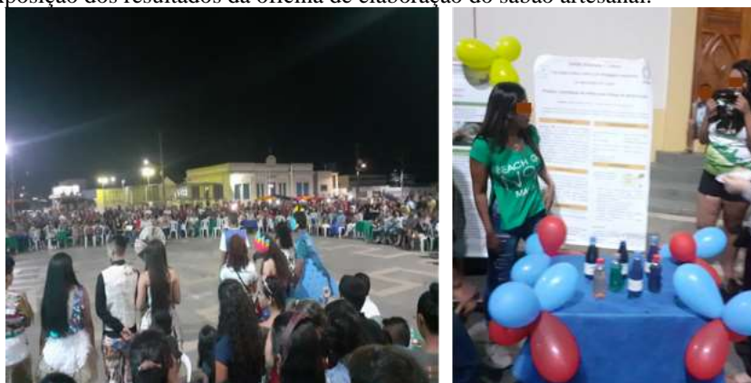
Figura 3 - Exposição dos resultados da oficina de elaboração do sabão artesanal.

No dia da apresentação, os discentes estavam inicialmente nervosos, no entanto, conseguiram descrever a metodologia de produção do sabão de forma correta, sendo uma experiência gratificante para os discentes que acompanharam as turmas. Os discentes puderam explicar as consequências do descarte inadequado do óleo residual para o meio ambiente e a importância da reciclagem. A atividade ocorreu em local público e de fácil acesso a população coariense (figura 3). Essa exposição permitiu que o restante da população pudesse ter acesso ao processo de reciclagem do óleo de fritura, bem como da importância do descarte adequado de matérias orgânicas.