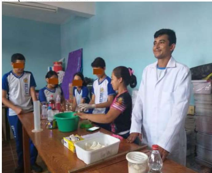
Figura 2 - Oficina de elaboração do sabão artesanal.

Na elaboração do sabão artesanal, os produtos foram desenvolvidos pelos próprios alunos com auxílio dos residentes responsáveis pelo projeto, onde foi possível ampliar sua autonomia motora e intelectual. Buscou-se explicar os principais produtos e suas propriedades toxicológicas e corrosivas, além apresentar a reação de uma substância pouco utilizável (óleo de fritura residual) em algo benéfico (sabão). A elaboração do material produzido pode ser visualizada na figura 2.