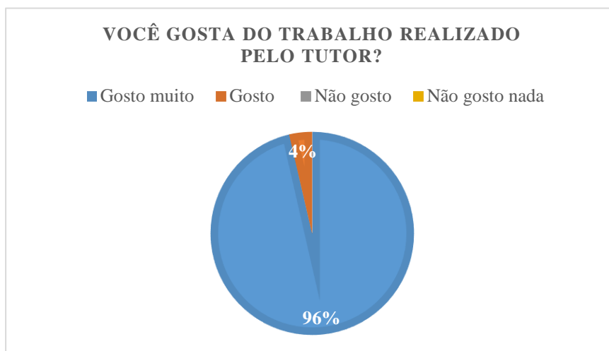
Gráfico 1: avaliação do trabalho do tutor

Fonte: elaborada pelos (as) autores (as) - 2019.