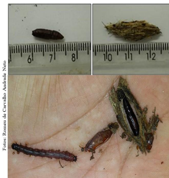
Figura 2. Dimensões da pupa e do casulo de Herminodes sp. registrados em açazeiro de touceira.

É difícil a observação da lagarta em plantios de açazeiro devido a sua permanência no